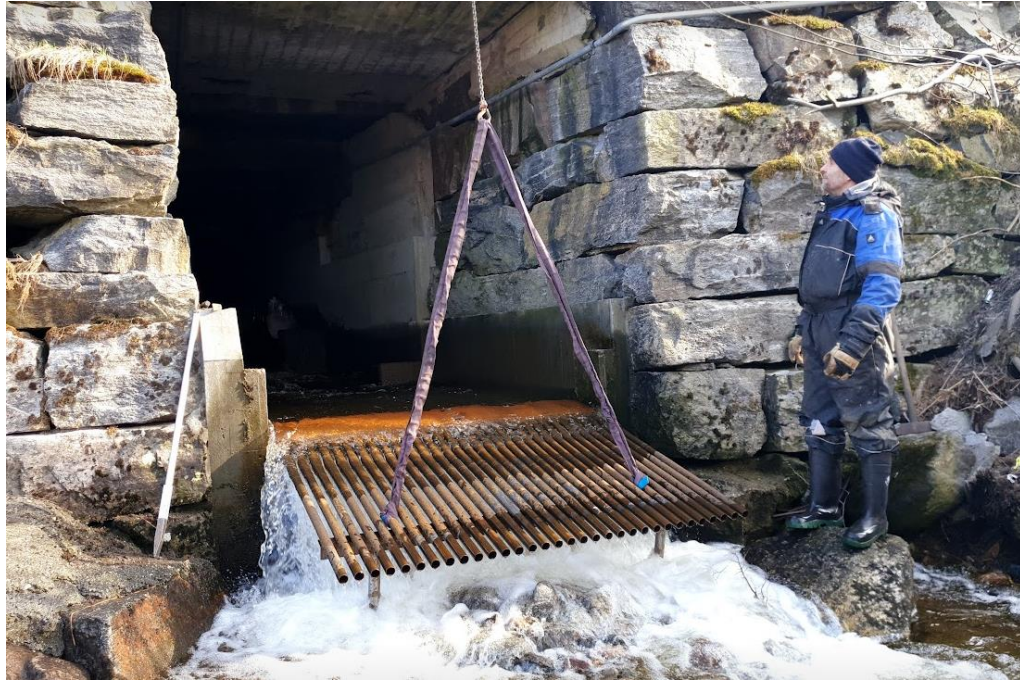
Montering av fiskesperre i Koksvikelva