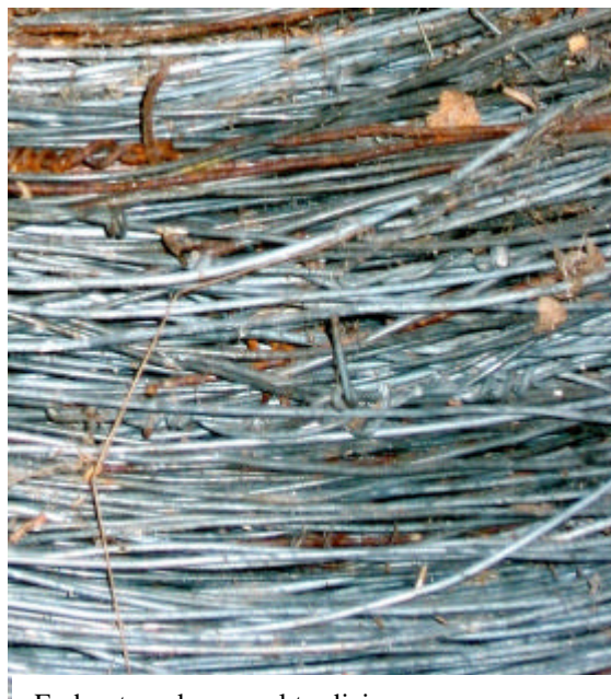
En bunt med gammel tradisjon...