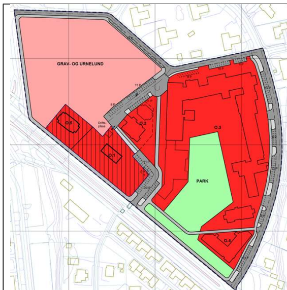
Figur 1 Reguleringsplan for helsetun- og kirkeområdet vedtatt 19.04.2006

Etter høringer og drøftinger er det kommet fram til løsninger som ivaretar behov for blant annet parkering, carporter, forbindelser for myke trafikanter, siktsoner og hensynet til kirkegårdsmur og kulturmiljø.