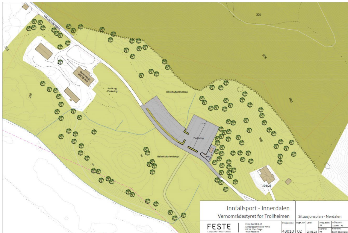
Figur 3: Situasjonsplan som viser sanitær-/servicehus og tilrettelegginger i Nerdalen.

Ekisterende utedo ved parkeringsplassen skal fjernes.