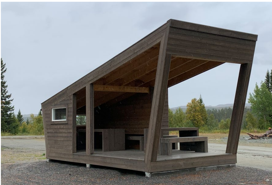
Bildeeksempel fra Infohus i Helgetunmarka

Det skal settes opp et informasjonshus, som vil inneholde parkeringsautomat, turistinformasjon, informasjon om Renndølsetra og Innerdalshytta (ikke verneinformasjon), samt bord og benker. Informasjonshuset vil fungere som en gapahuk, der en kan trekke i ly for vær og vind. Informasjonshuset skal ha åpningen mot sør, og mot infoplassen.