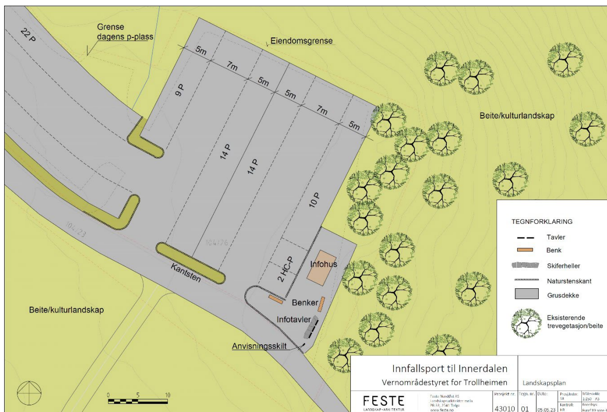
Figur 2: Landskapsplan som viser parkering og infoplass i Nerдалen.

Materialbruken og utformingen bygger på eksisterende situasjon. Parkeringsplass og infoplass er foreslått med grusdekke. Foran tavlene er det vist natursteins-/skiferheller og mellom parkering og informasjon er det foreslått kant i naturstein. Utforming av benker er vist i tre og cortenstål.