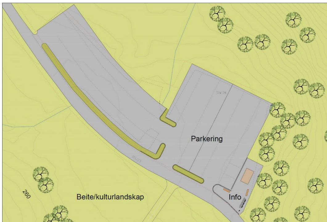
Figur 1: Landskapsplan som viser parkeringsplassen i Nerdalen.

Landskapsplanen for området viser en justering av parkeringsplassen. Dette for å oppnå en bedre utnyttelse. Inn- og utkjøring av plassen er snevret inn for å kanalisere trafikken. I den sørøstre delen av parkeringsplassen er det vist en ny plass for informasjon, benker og infohus.