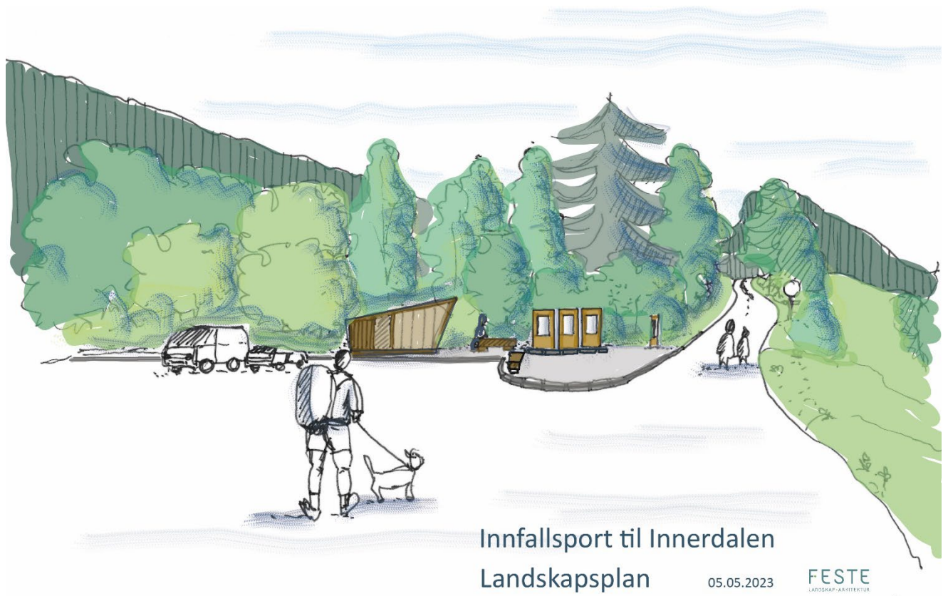
Figur 4: Perspektivtegning – Infoplass sett fra vest mot øst.