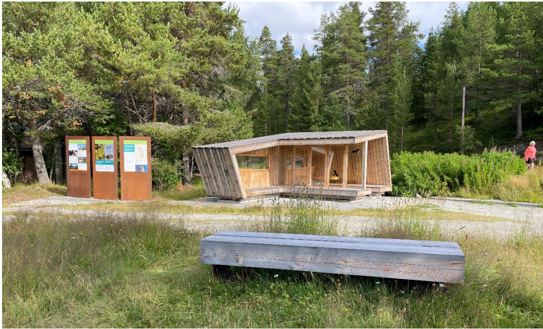
Bilde fra Synnervika i Femundsmarka. Informasjonstavler i cortenstål, gapahuk og nye benker.

Oversiktsplanen, fig 3 viser parkering, infoplass og sanitær-hus. Det skal legges til rette for dusjmuligheter og toalett i fjøset/låven på tunet vest for parkeringsplassen. Dette tilbudet vil serve dagsturister og andre turgåere. I tillegg til sanitærfunksjoner er det planer om utvikling av matservering og overnatting.