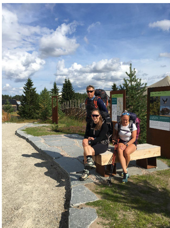
Bildeeksempler fra Elgå i Femundsmarka. Spesiellagede benker i malmfuru og cortenstål, skiferplass og kantstein.