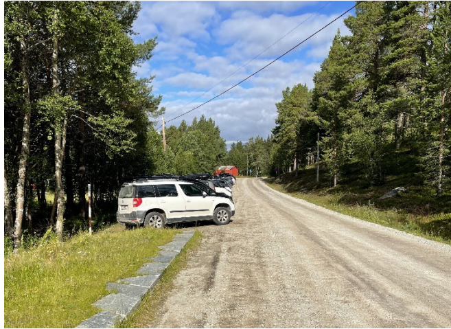
Bildeeksempler: Parkeringsplass med natursteinskant. Fra Synnervika - kantstein langs vegen.

Det skal settes opp et informasjonshus, som vil inneholde parkeringsautomat, turistinformasjon, informasjon om Renndølsetra og Innerdalshytta (ikke verneinformasjon), samt bord og benker. Informasjonshuset vil fungere som en gapahuk, der en kan trekke i ly for vær og vind. Informasjonshuset skal ha åpningen mot sør, og mot infoplassen.