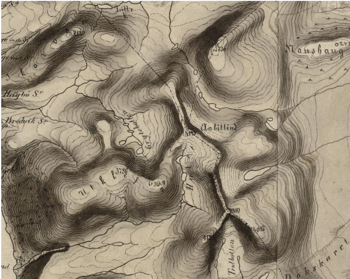
Utsnitt av rektangelmåling fra 1887 med Abittind (4173 fot = 1309 m) sentralt i bildet. Videre er Utklejva , Skarven og Nonshaug navnsatt.

https://kartverket.no/om-kartverket/historie/historiske-kart/soketreff/mitt-kart?mapId=9305