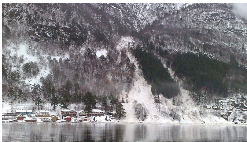
Snøras over riksveg 70 i Oppdølstranda i mars 2010

Ansvarlig for ajourhold: beredskapsplanlegger