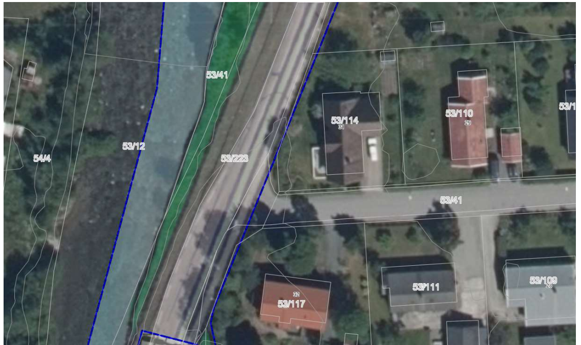
Flyfoto med visning av reguleringsplan for ny vegtrase

Realiseringen av reguleringsplanen med utbedring/flytting av fylkesvegen i dette området blir tatt med i plan for trafiksikkerhet i Sunndal kommune som skal se vegprosjekter i sammenheng og gi innspill på prioriterte prosjekter på fylkesveger til fylkeskommunen. Etter at trafiksikkerhetsplanen er vedtatt blir prioritierungslisten oversendt fylkeskommunen som eier av fylkesvegen.