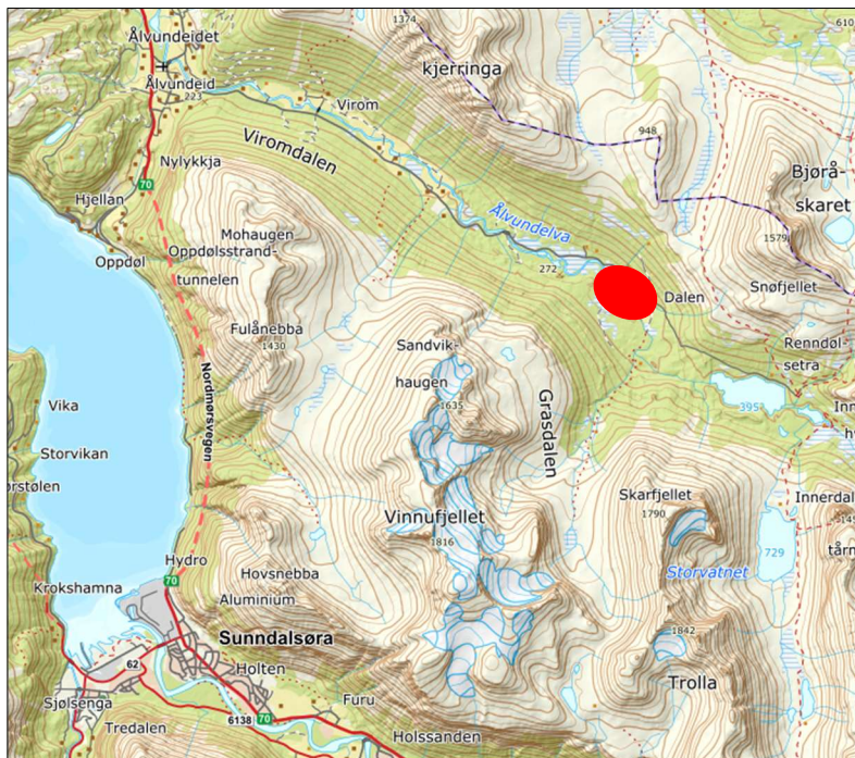
Figur 1: Planområdet er avmerket med rød ring. Nerdal gård ligger innerst i Viromdalen i Sunndal kommune (norgeskart.no)

I henhold til plan- og bygningslovens § 12-8 varsles oppstart av reguleringsplanarbeid for Nerdal gård, Sunndal kommune. Planen vil bli utarbeidet som detaljreguleringsplan, jf. plan- og bygningslovens § 12-3.